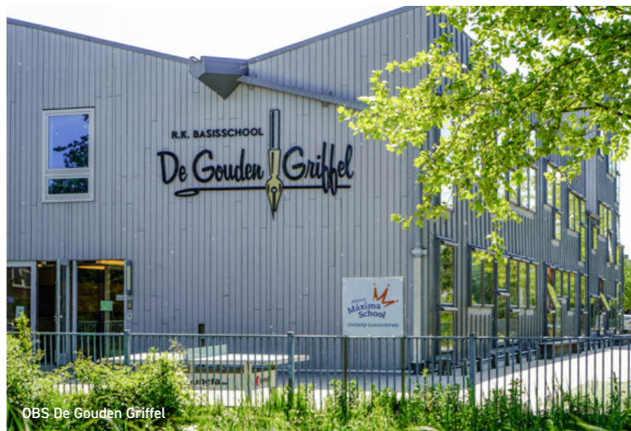
OBS De Gouden Griffel