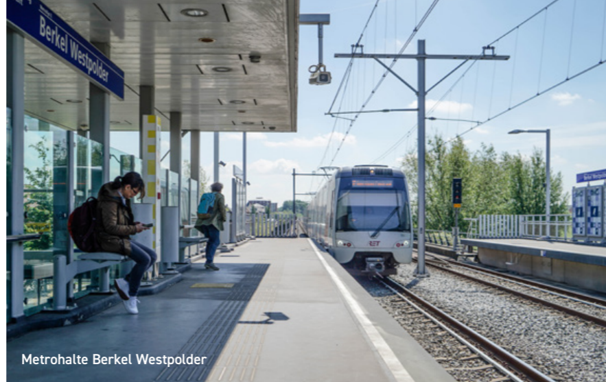
Metrohalte Berkel Westpolder

In De Groenzoom vind je soms flamingo's en kun je heerlijk wandelen en fietsen. De Rotte biedt met haar levendige kades en groene natuuroevers veel mogelijkheden voor ontspanning, denk aan fietsen, kanoën en roeien. Ook 'Outdoor Valley' en Golfbaan De Hooge Rotterdamsche bevinden zich in het Rottegebied. Wil je naar de stad? Den Haag, Delft, Rotterdam en Zoetermeer zijn goed en snel bereikbaar via de provinciale wegen of met het openbaar vervoer. Ook Rotterdam The Hague Airport is goed en snel te bereiken. De Gouden Buurten heeft een eigen metrostation. Vanaf station Berkel Westpolder sta je binnen 10 minuten op de Coolsingel en in ruim 20 minuten ben je in hartje Den Haag. Zo kun je het wonen in de luwte moeiteloos combineren met de voordelen van het bruisende stadsleven. ◇